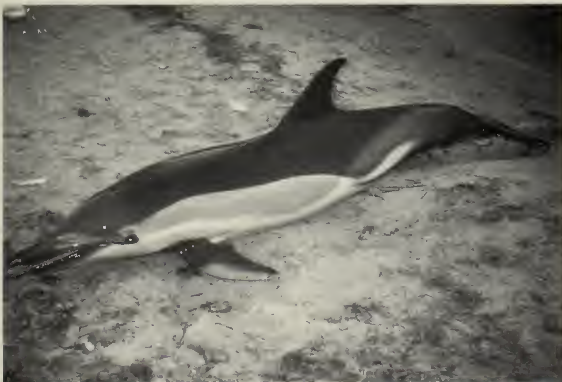
Fig. 3 – Il delfino comune ( Delphinus delphis ) spiaggiato a Porto Botte (Cagliari) il 30 luglio 1990.